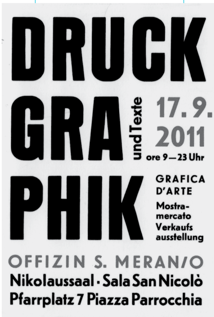
Siegfried Höllrigl: Plakat aus der Offizin S. mit Einladung zu einer Verkaufsausstellung (2011)

bolisiert Zeiteinteilung, Ablauf, Wiederkehr, Kontinuität im Wandel – und mithin wird er zum Spiegel eines Lebens, in der Wirkung möglicherweise vergleichbar der Wucht jener Megainstallation „the refusal of time“ des Australiers William Kentridge, die dem Zuschauer im Kasseler Hauptbahnhof seine Zeitlichkeit unmittelbar und eindrücklich vor Augen und Ohren führt, aber wohl etwas leiser als diese und vielleicht nachdenklicher. „Wer wie ich das